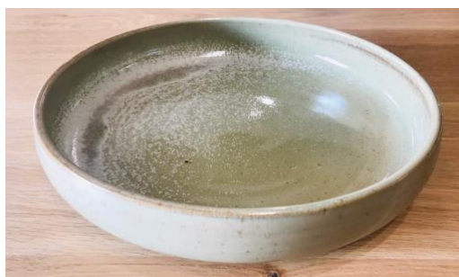
KO NVG PCM / KO NVG PC