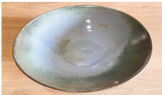
MA NPB AC / MA NPB APA