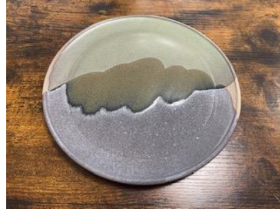
KO GO AD/AP

Ass Plate Graphit/Opaline D20 ou D 25 cm