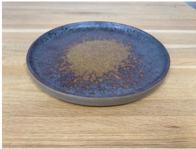
BA ES AD / AP

Ass Plate Eclipse D 18 cm / 24,5 cm H 1,5cm