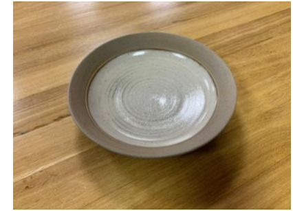
FO NA AC

Ass Creuse Naturel/Grès D 19,5cm H 3,5cm