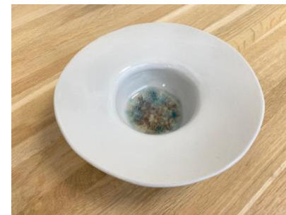
CAPELLO – SEA GLAZED