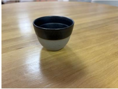
FO AN TC