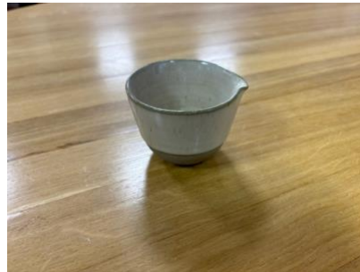
FO NA CR