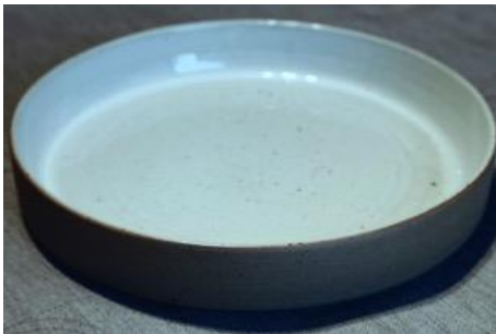
BA IV AC GM