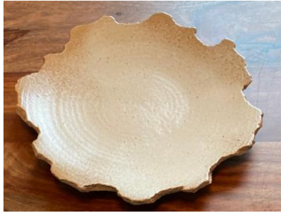
FR SI AP/AD