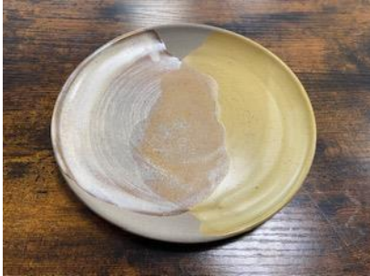
KO ON AD/AP