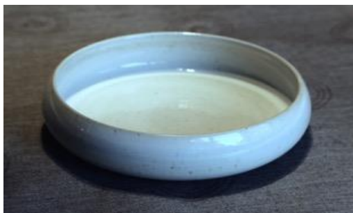
KO IV PCM / KO IV PC