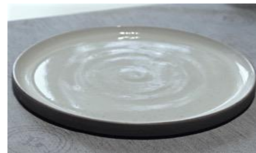
GPIVPL0 / GPIVPL1 / GPIVPL2