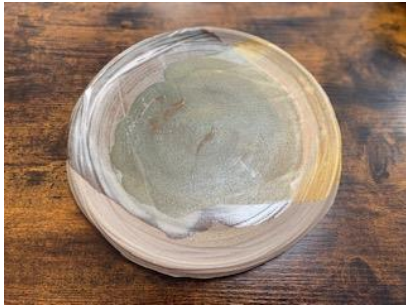
RE ON APPM / APMG