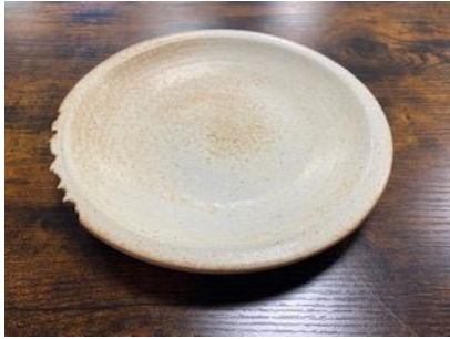
CA SI AP/AD