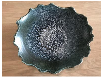
FR LU ACGM