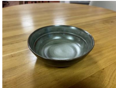
FO BR EC MM