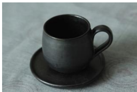
KO AN TM / KO AN SC Tasse et Sous-Tasse à Café Noire