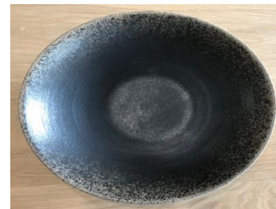
MA SP AN AC / APA