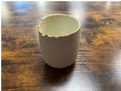
CA SI G10/25