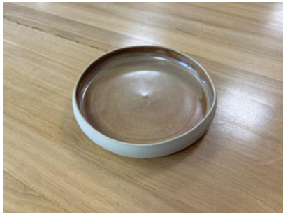
ARB BP CH PM – CHOCOLAT Assiette à rebord D 17 cm H 3 cm