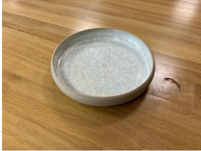
ARB BP AP PM – BLANC POLAIRE Assiette à rebord D 17 cm H 3 cm