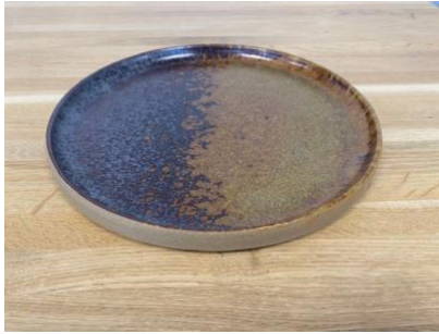
BA EL AD / AP

Ass Plate Eclipse D 18 cm / 24,5 cm H 1,5cm