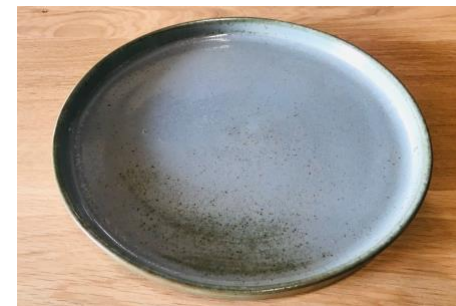
GPNPBPL0 / GPNPBPL1 / GPNPBPL2