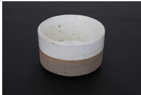
BA IV B7 / BA IV B15