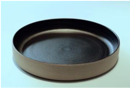
BA AN AC GM