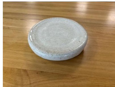
GAL BP MM – BLANC POLAIRE Galet D 16 cm H 3,5 cm