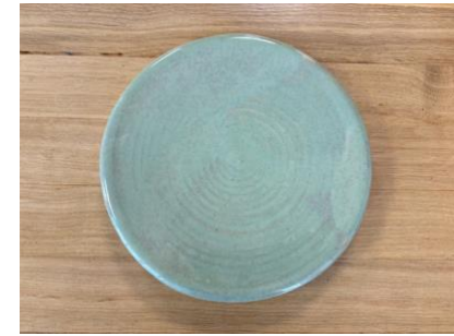
GAL VT GM – VERT THÉ Galet D 20 cm H 2,5 cm