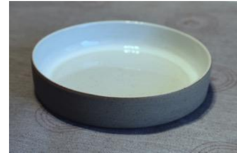
BA IV AC