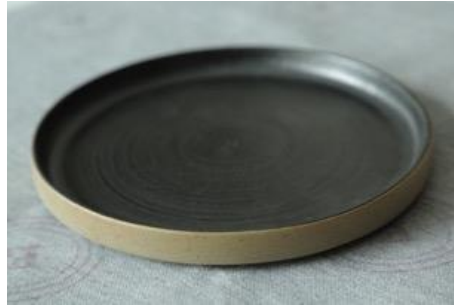
BA AN AP