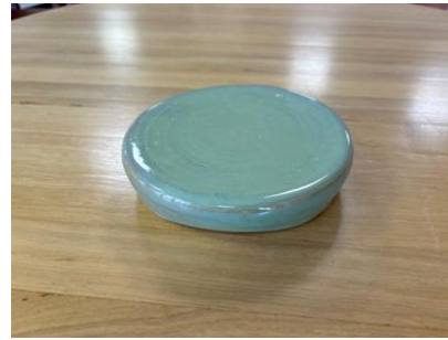
GAL VT MM – VERT THÉ Galet D 16 cm H 3,5 cm