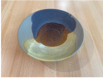
MA GC AC/APA

Ass Creuse Graphite/Cuivre D19/24cm H5,5cm