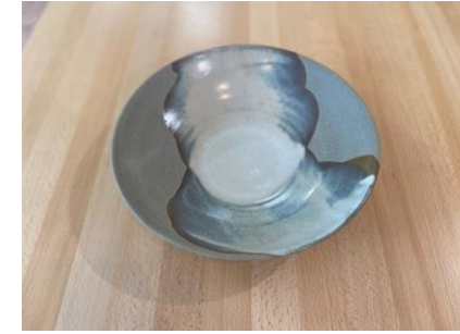
MA BN AC/APA

Ass Creuse Sisal/Naturel D19/24cm H5,5cm