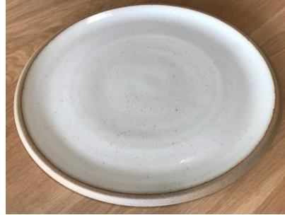
DU IV AP PM / GM

Ass Ultra Plate Bleu Baltique D 24 / 30 cm