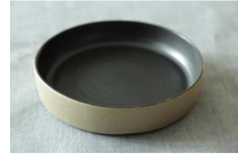
BA AN AC