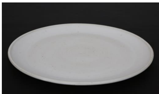
KO IV AP