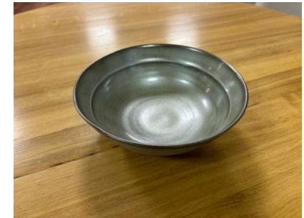
FO BR EC GM