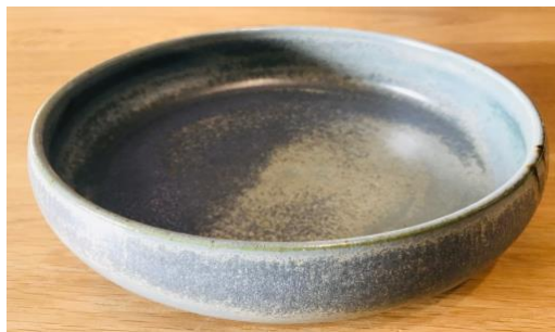
KO NPB PCM / KO NPB PC