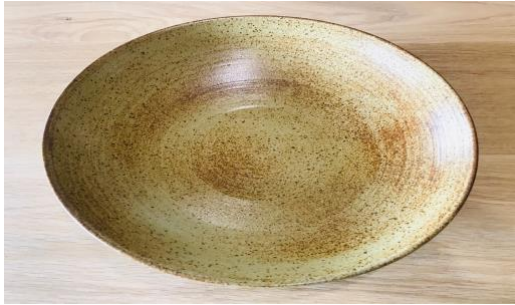
MA RU AC / MA RU APA