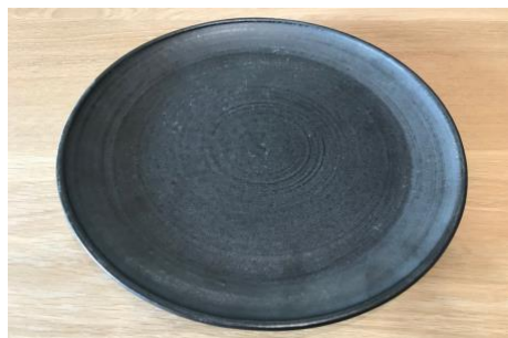
KO AN AP Assiette Plate D 25cm