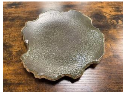
FR LU AP/AD