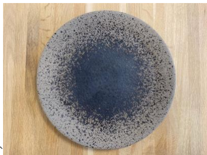
MA SP AN AD / AP