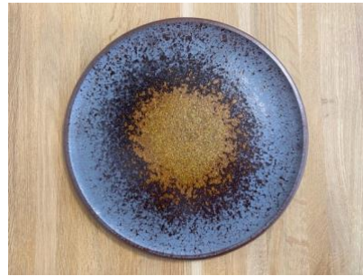
DU ES AP PM / GM

Ass Plate Eclipse D 18 cm / 24,5 cm H 1,5cm