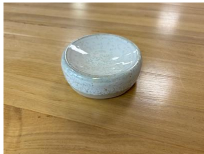
GAL BP PM – BLANC POLAIRE Galet D 10 cm H 4,5 cm