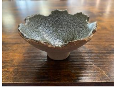
FR LU BMM/BPM