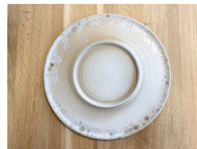
SATURNO - MOON