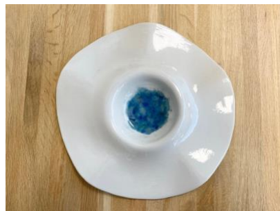
MANTA WAVES – SEA GLAZED