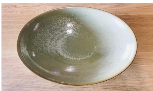
MA NVG AC / MA NVG APA