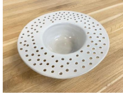
CAPELLO - PITTED