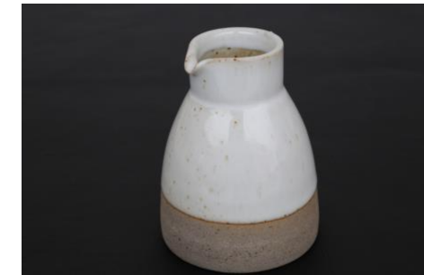
MA IV CR10