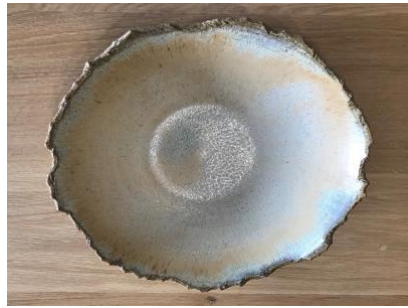
FR OP ACGM