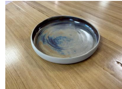
ARB BP CH GM – CHOCOLAT Assiette à rebord D 22 cm H 3 cm