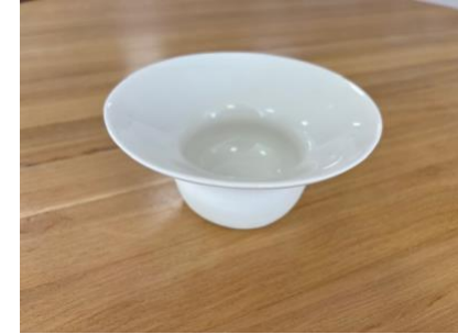
DRA BB AC PM - PORCELAINE Assiette AB D 17 cm (int 8 cm) H 6 cm