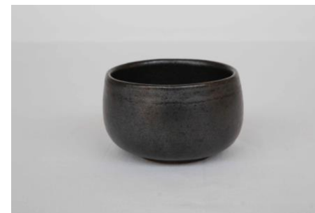
KO AN B25 Bol Noir 25 cl