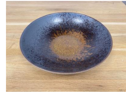
MA ES AC / APA