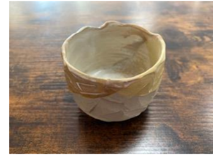
RE ON GGM