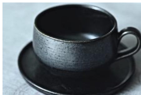
KO AN TT / KO AN ST Tasse et Sous-Tasse à Thé Noire