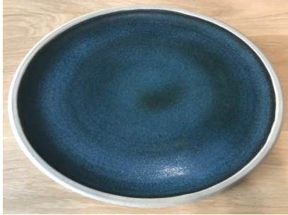
DU BB AP PM / GM

Ass Ultra Plate Bleu Baltique D 24 / 30 cm