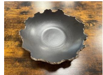
FR AN ACGM