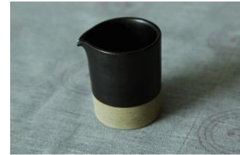
BA AN CR