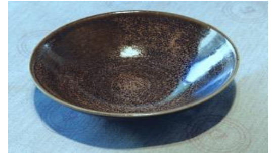
MA KS AC / MA KS APA