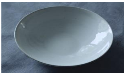
MA IV AC / MA IV APA