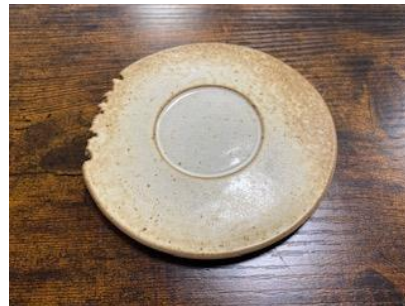
CA SI SOPM/SOMM