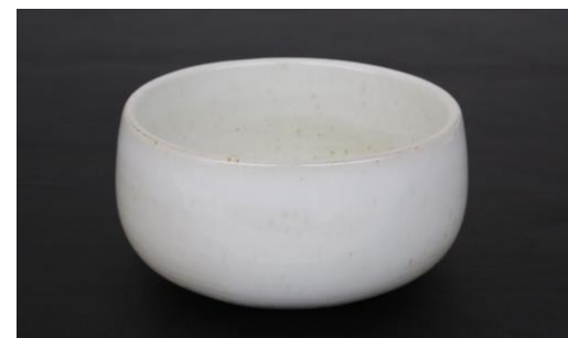
KO IV B25