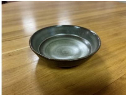
FO BR EC PM

Ass Creuse Naturel/Grès D 19,5cm H 3,5cm