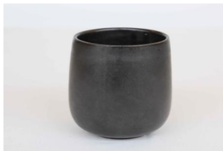
KO AN G10/ KO AN G25 Gobelet Noir 10 ou 25 cl