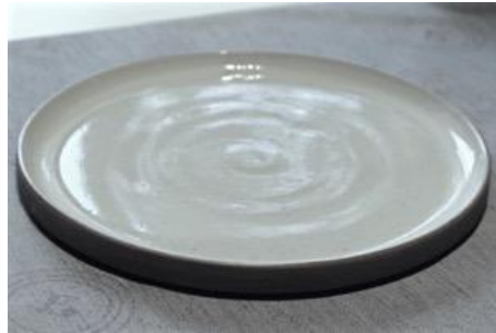
BA IV AP