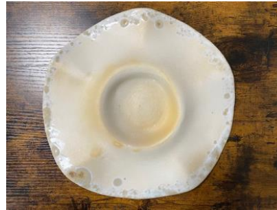
MANTA WAVES - MOON