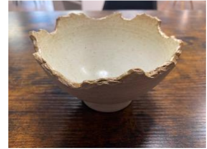
FR SI BMM/BPM