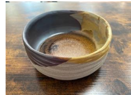
RE GC BGM