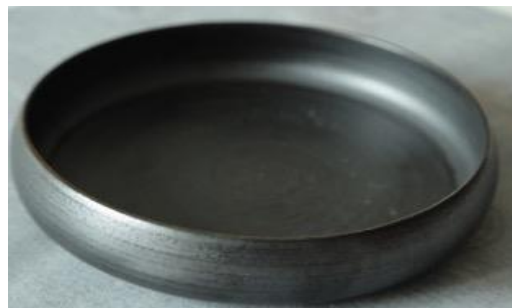
KO AN PCM / KO AN PC