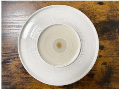
SATURNO – SINGLE POIS