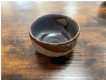
RE GO BPM