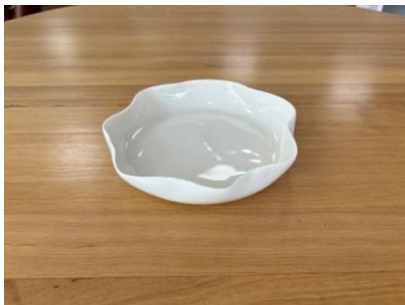
DRA BB AP PM - PORCELAINE Assiette Plate D 16 cm H 3 cm