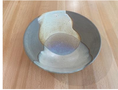
MA SN AC/APA

Ass Creuse Graphite/Cuivre D19/24cm H5,5cm