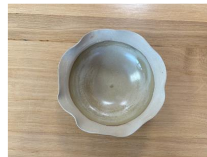
CAP SA PM – SABLE

Bol Capsule D 17 cm (int 13 cm) H 6,5 cm