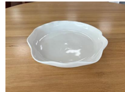
DRA BB AP GM - PORCELAINE Assiette Plate D 23 cm H 3 cm