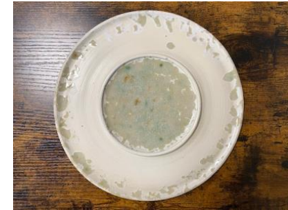
SATURNO – MOON GLAZED INSIDE