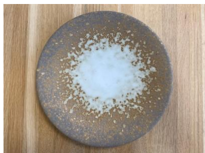
MA SP IV AD / AP