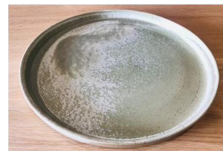
GPNVGPL0 / GPNVGPL1 / GPNVGPL2

Ass Plate Reb Verte D 17/23/27cm H 1,8cm