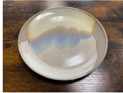
KO SN AD/AP

Ass Plate Graphite/Cuivre D20 ou D 25 cm