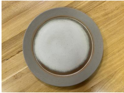
FO NA AD