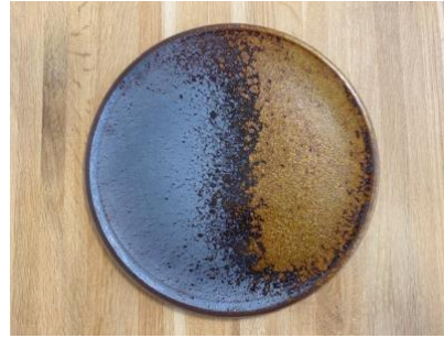
DU EL AP PM / GM

Ass Plate Eclipse D 18 cm / 24,5 cm H 1,5cm