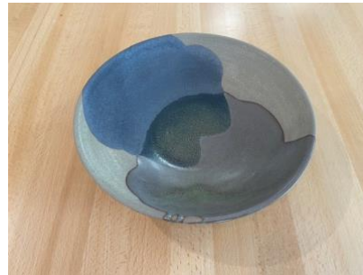
MA GO AC/APA

Ass Creuse Graphit/Opaline D19/24cm H5,5cm