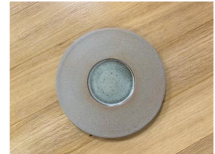
FO BR SMM