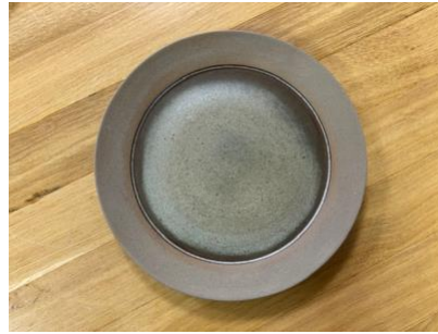
FO BR AP