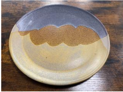
KO GC AD/AP

Ass Plate Graphite/Cuivre D20 ou D 25 cm