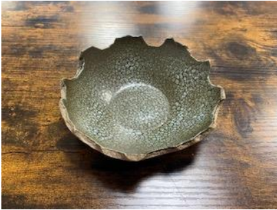
FR LU CO