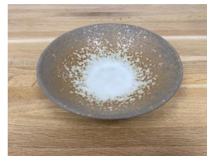
MA SP IV AC / APA