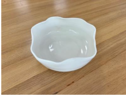
DRA BB BOL – PORCELAINE Bol Drapé D 15 cm H 5,5 cm