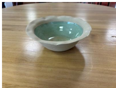
CAP VT PM – VERT THÉ

Bol Capsule D 17 cm (int 13 cm) H 6,5 cm