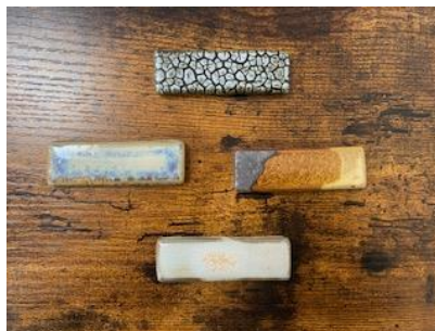
PCT - Porte-Couteau D 7 x 2,3 cm