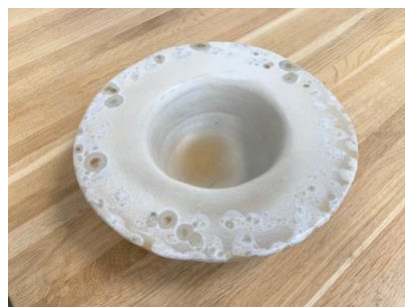
CAPELLO - MOON