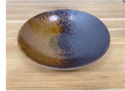
MA EL AC / APA