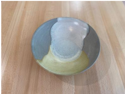
MA ON AC/APA

Ass Creuse Brume/Naturel D19/24cm H5,5cm