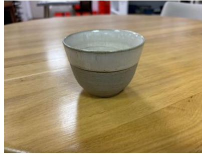
FO NA TT