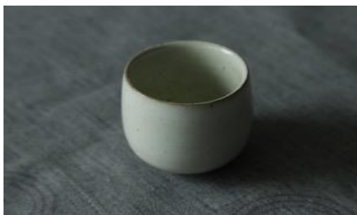
KO IV G10/ KO IV G25