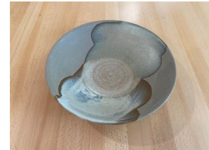
MA BB AC/APA

Ass Creuse Graphit/Opaline D19/24cm H5,5cm