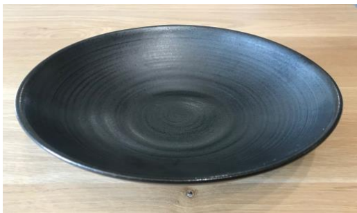
MA AN AC / MA AN APA