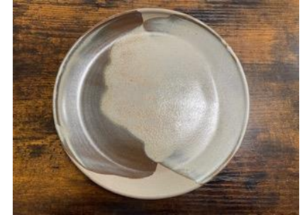
KO BB AD/AP

Ass Plate Graphit/Opaline D20 ou D 25 cm