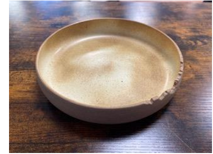
CA SI PC/PCM