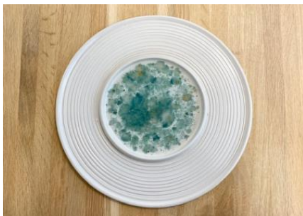
SATURNO – SEA GLAZED