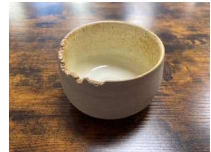
CA SI BPM/BMM/BGM

Bol Canopée Petit – Moyen – Grand Modèle