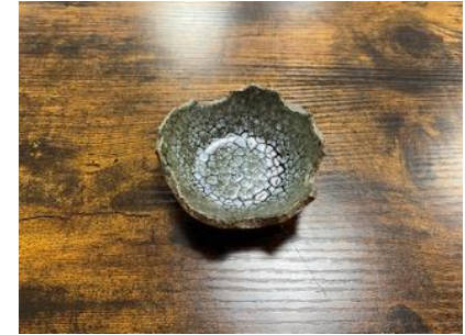
FR LU MC