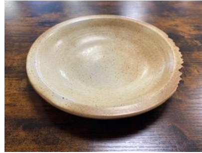
CA SI AC