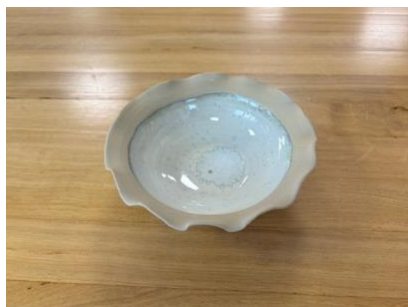
CAP BP PM – BLANC POLAIRE

Bol Capsule D 17 cm (int 13 cm) H 6,5 cm