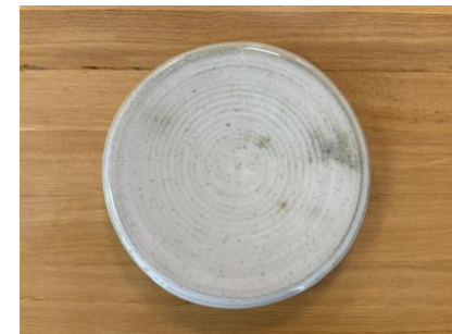
GAL BP GM – BLANC POLAIRE Galet D 20 cm H 2,5 cm