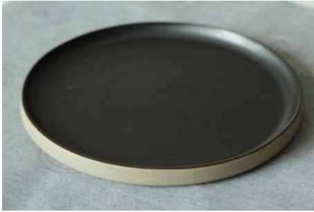
BA AN AD