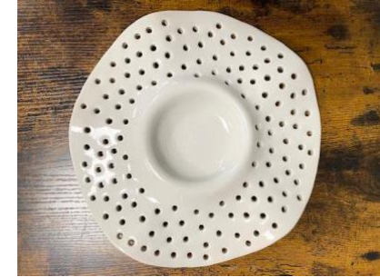
MANTA WAVES - PITTED