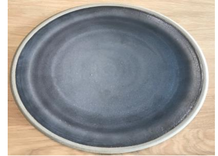
DU AN AP PM / GM