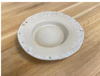
CAPELLO TULLIO - MOON