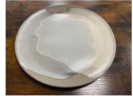
KO BN AD/AP