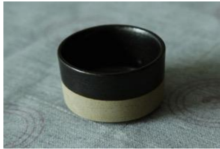
BA AN B7/BA AN B15