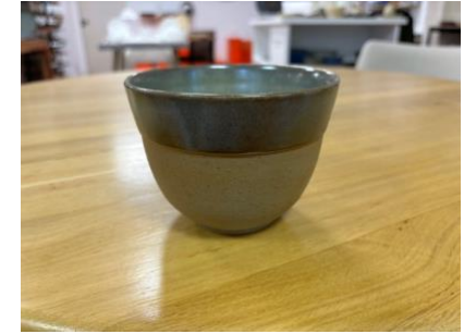
FO BR TCH