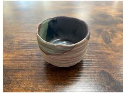
RE GO GPM