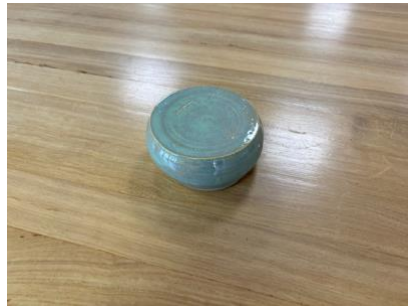
GAL VT PM – VERT THÉ Galet D 10 cm H 4,5 cm