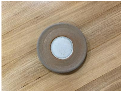
FO NA SPM