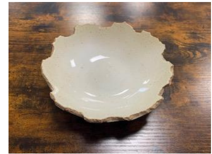
FR IV ACGM