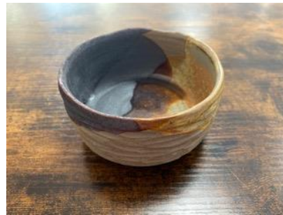
RE GC BMM