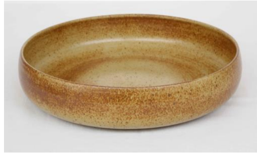
KO RU PCM / KO RU PC