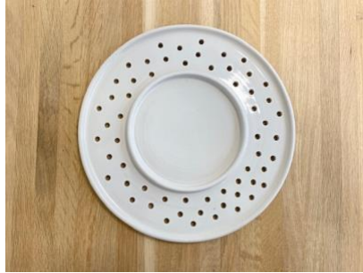
SATURNO – PITTED