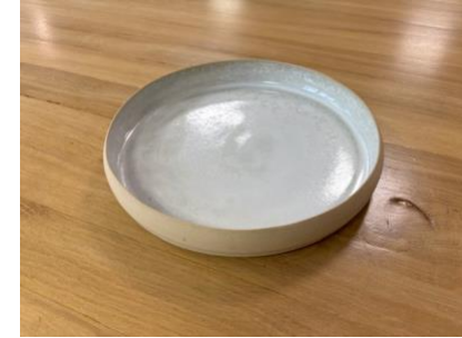
ARB BP AP GM – BLANC POLAIRE Assiette à rebord D 22 cm H 3 cm