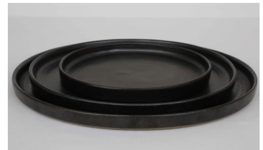
GPANPL0 / GPANPL1 / GPANPL2