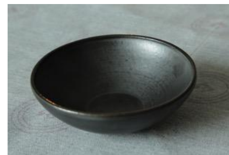
KO AN CO Coupelle Noire D 14cm H 4,5cm